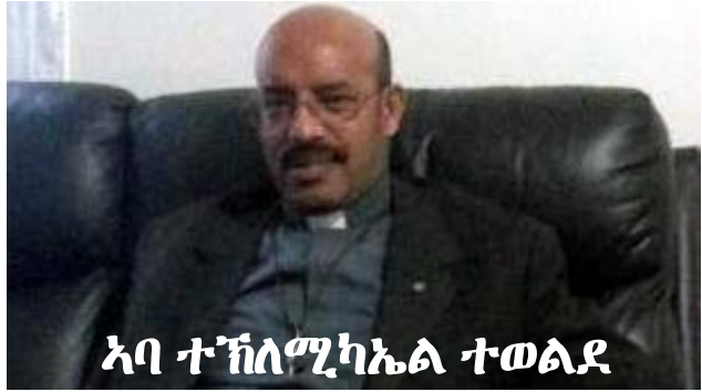
አባ ተክለሚካኤል ተወልደ

ካብ 1991 ክሳብ ዛጊት፡ 728 ዓመታት፡ ኢሳያስ አፈወርቂ ንኤርትራውያን ብምፍርራሕን ብምእሳርን ብምቕታልን ንጣር ቁልዒ ከይትባራዕ