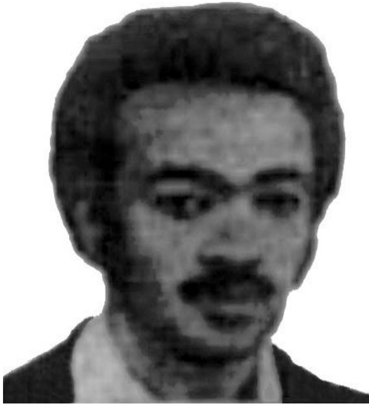
ስዉእ ሃይለ ጋርዛ አብ ጁን 24፣ 1984፣ አብ ካርቱም፣ ብነብሰ ገዳያት እንዳ-72 ተቐትለ።

ሃይለ ጋርዛ፡ ተጋዳላይ ናይ ተጋድሎ ሓርነት ኤርትራ ነበረ። ተ. ሓ. ኤ.፡ አብ 1982፡ ሱዳን ድሕሪ ምእታው፡ ሃይለ ጋርዛ፡ አቦ ወንበር ናይ Eritrean Red Cross and Crescent Society (ERCCS) ዝተባህለ ናይ ግብረ ሰናይ ማሕበር ነበረ።