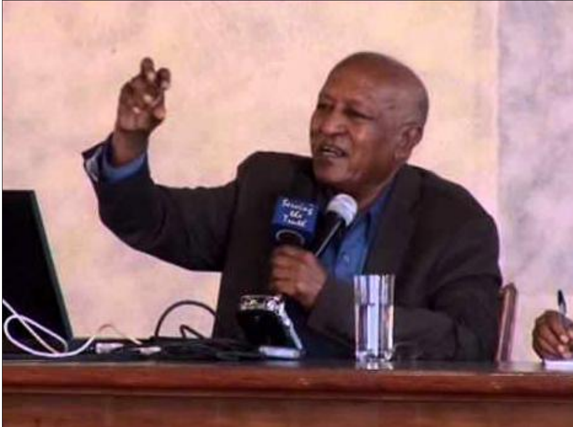
ሰመረ ርእሶም፡ የእዳዉ ብደም ጀጋኑ ዝጨቀወ ዕሉል ናይ ቅጽዖ ሰብ።